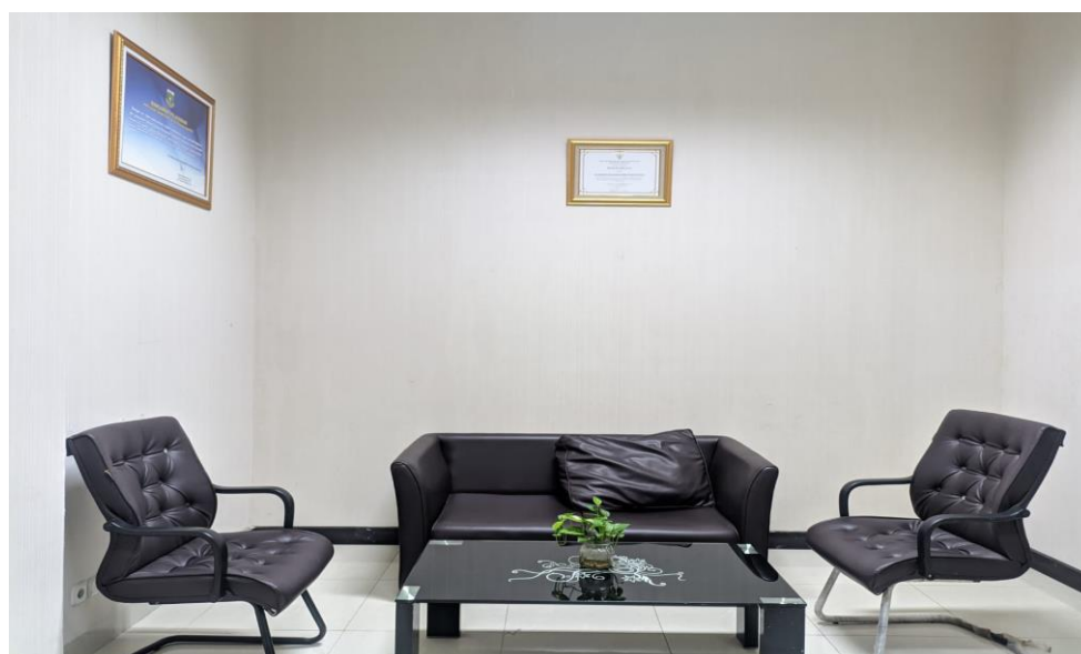
II.1. Gambar ruangan Desk layanan Informasi Publik