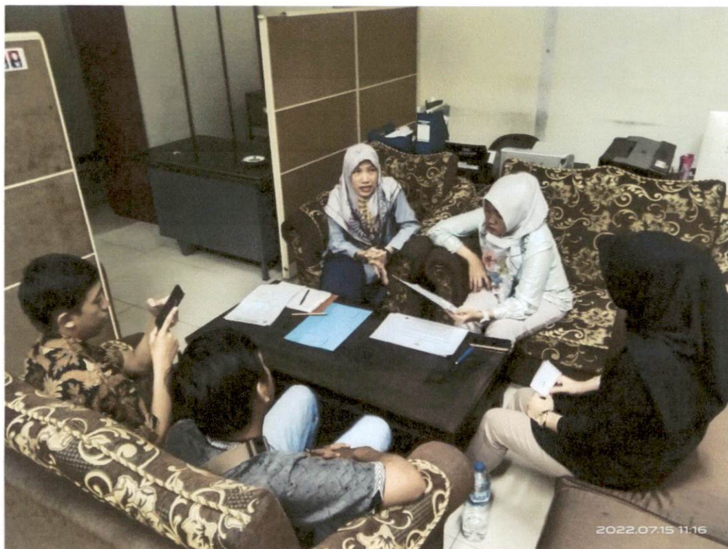
Rapat Rutin PPID Pelaksana Biro Umum dan Perlengkapan