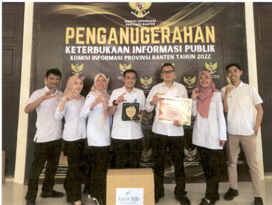
PPID Pelaksana Biro Umum dan Perlengkapan Meraih Penghargaan Keterbukaan Informasi Publik Tahun 2022 dengan kategori sebagai badan publik "Informatif"