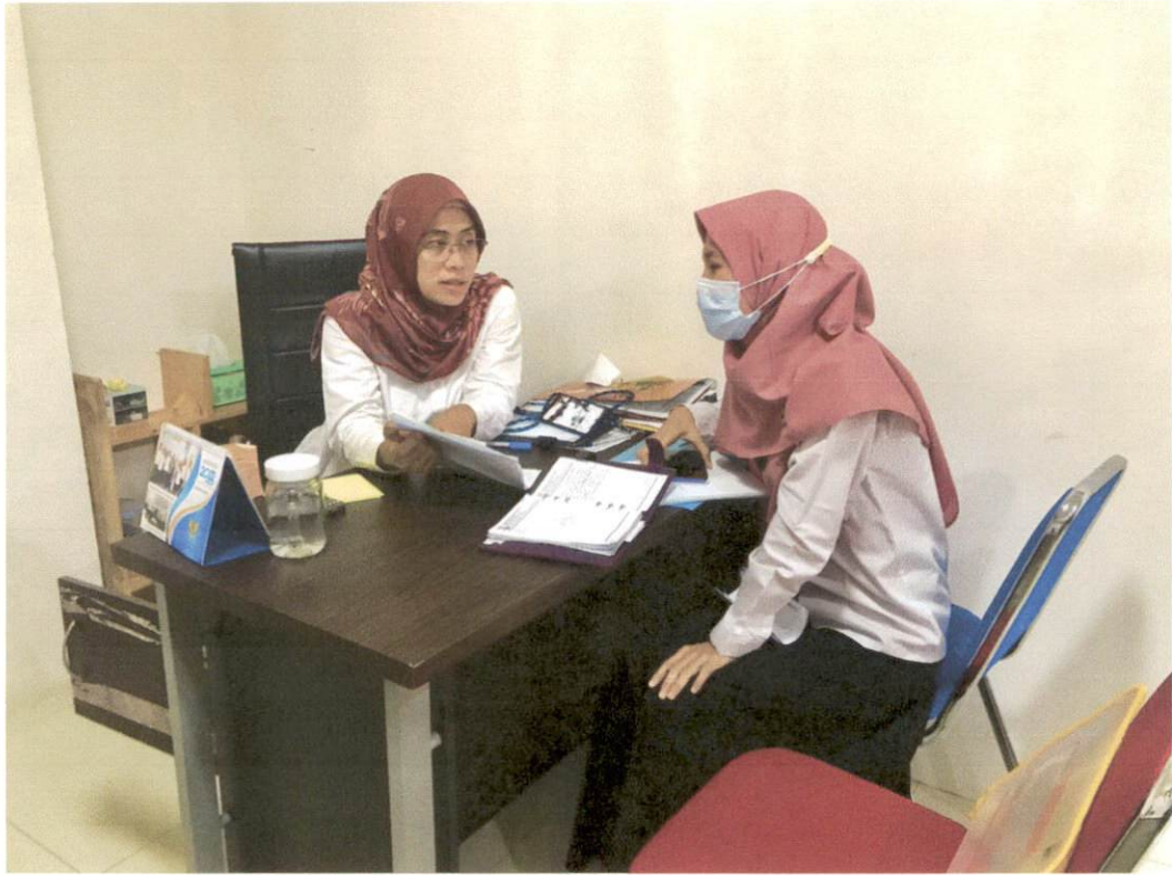
Konsultasi PPID Pelaksana Biro Umum dan Perlengkapan Kepada Dinas Komunikasi dan Informatika Provinsi Banten