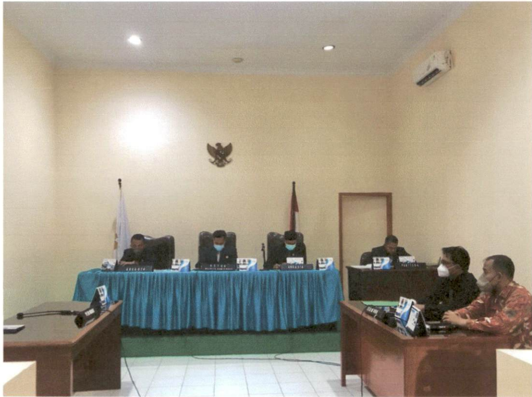
PPID Pelaksana Biro Umum dan Perlengkapan mendampingi PPID Utama Provinsi Banten dalam sidang sengketa informasi