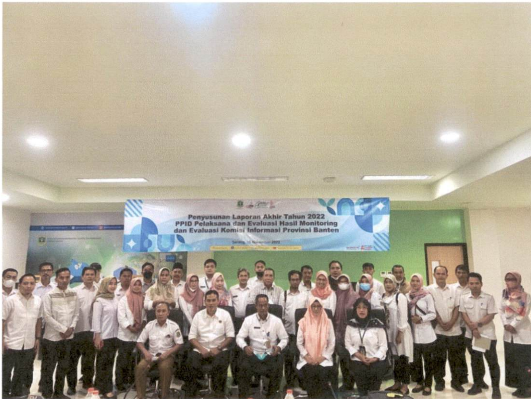
PPID Pelaksana Biro Umum dan Perlengkapan mengikuti Bimtek Penyusunan Laporan Akhir Tahun 2022