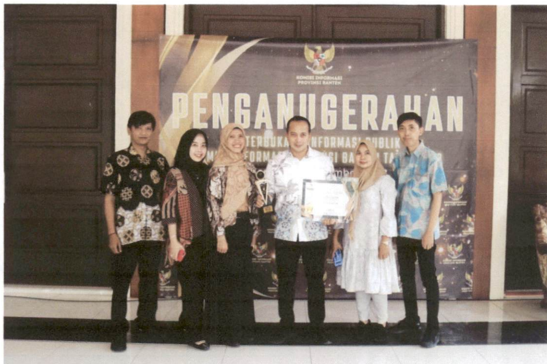
PPID Pelaksana Biro Umum dan Perlengkapan Meraih Penghargaan Keterbukaan Informasi Publik Tahun 2023 dengan kategori sebagai badan