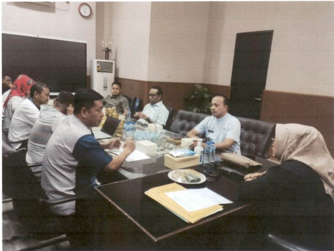
Rapat Rutin PPID Pelaksana dengan para pejabat struktural Biro Umum dan Perlengkapan