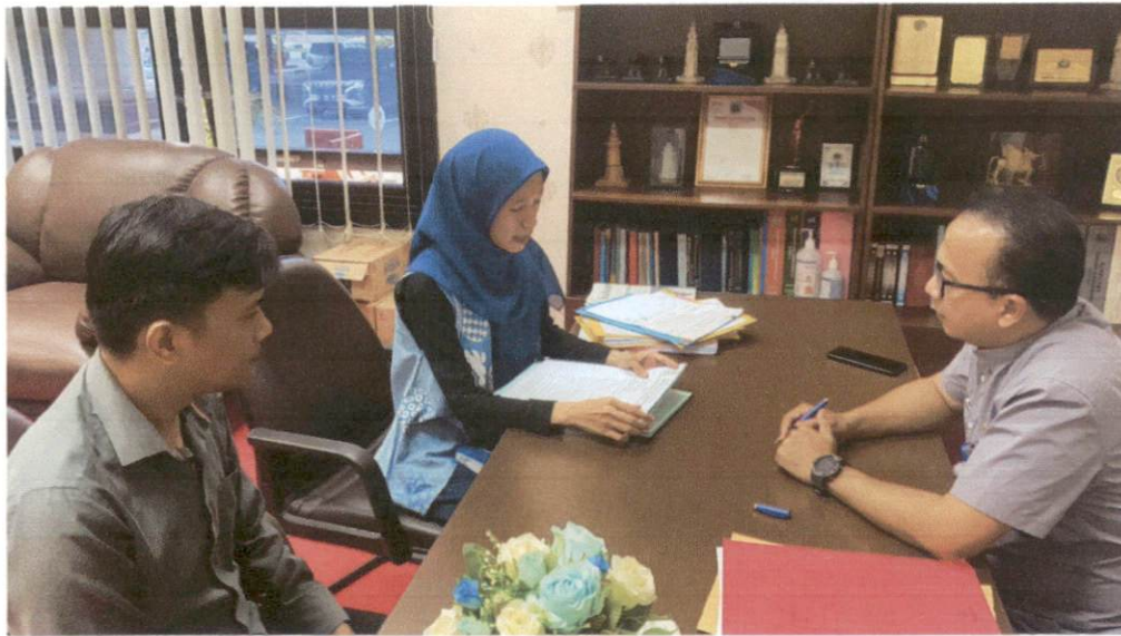
PPID Pelaksana Biro Umum dan Perlengkapan melakukan diskusi terkait Permohonan Informasi Publik Tahun 2023