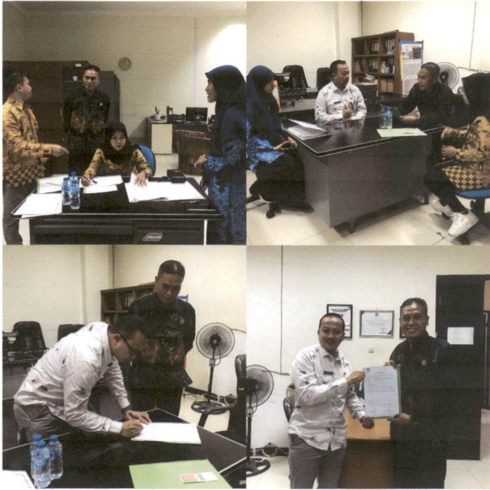
Biro Umum dan Perlengkapan menerima Tim Komisi Informasi Provinsi Banten dalam rangka Visitasi Monitoring dan Evaluasi Keterbukaan Informasi Publik 2023