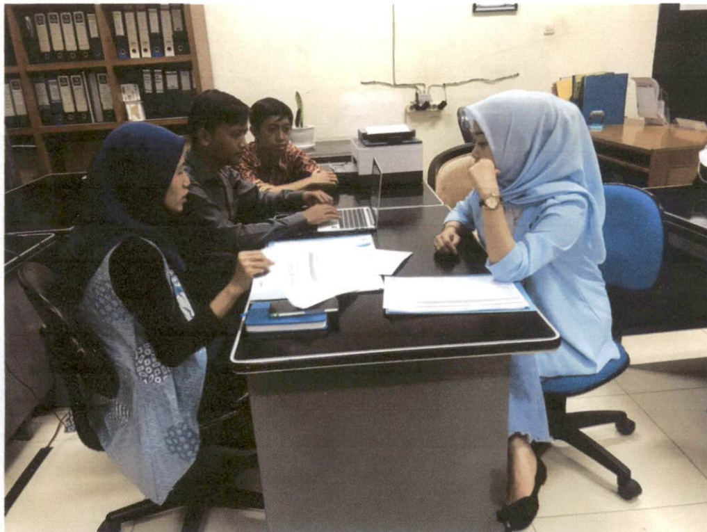
Rapat Rutin PPID Pelaksana Biro Umum dan Perlengkapan