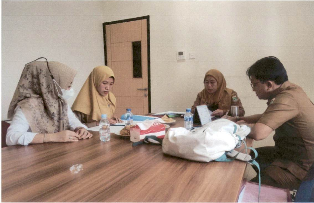
Rapat persiapan sidang sengketa informasi publik Biro Umum dengan Biro Hukum dan PPID Provinsi Banten