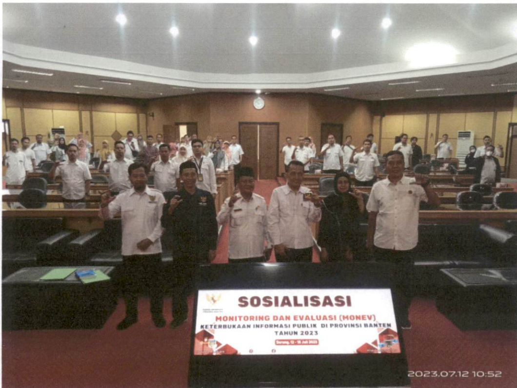
PPID Pelaksana Biro Umum dan Perlengkapan mengikuti Sosialisasi Monitoring dan Evaluasi (MONEV) Tahun 2023