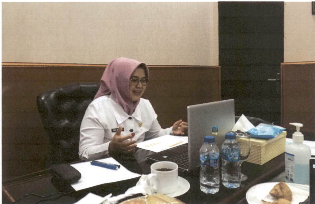
Presentasi Monitoring dan Evaluasi Keterbukaan Informasi Publik 2023 yang dilakukan oleh Plt. Kepala Biro Umum dan Perlengkapan