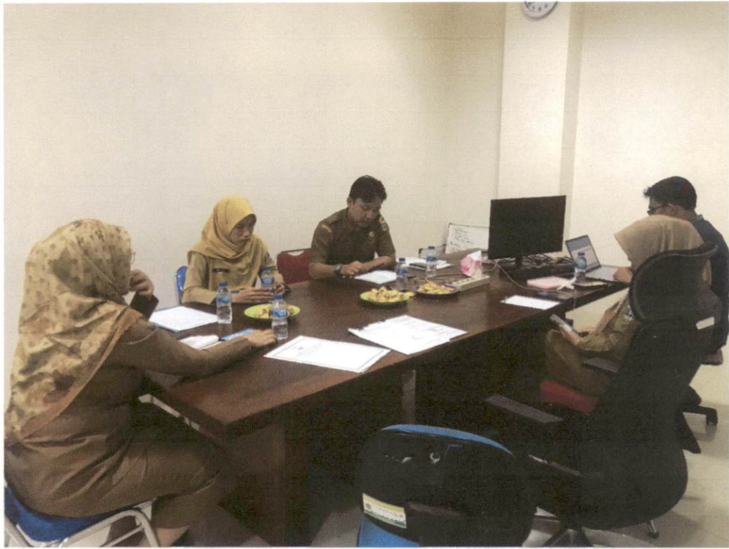
Konsultasi PPID Pelaksana Biro Umum dan Perlengkapan kepada PPID Provinsi Banten terkait sengketa informasi publik