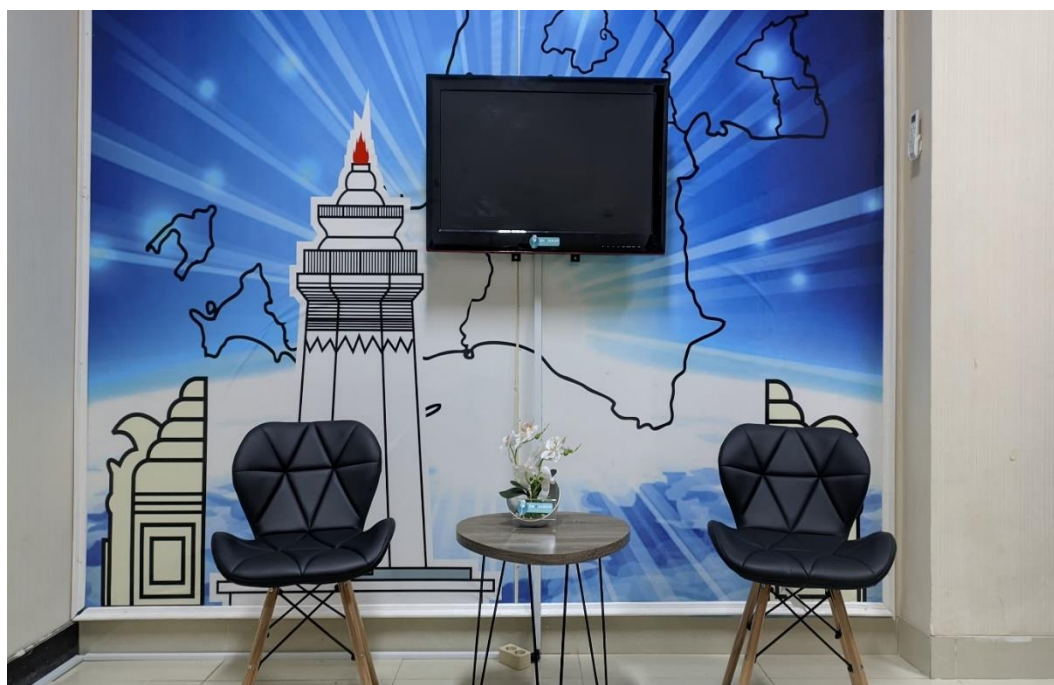
II.2. Gambar ruangan Podcast Biro Hukum