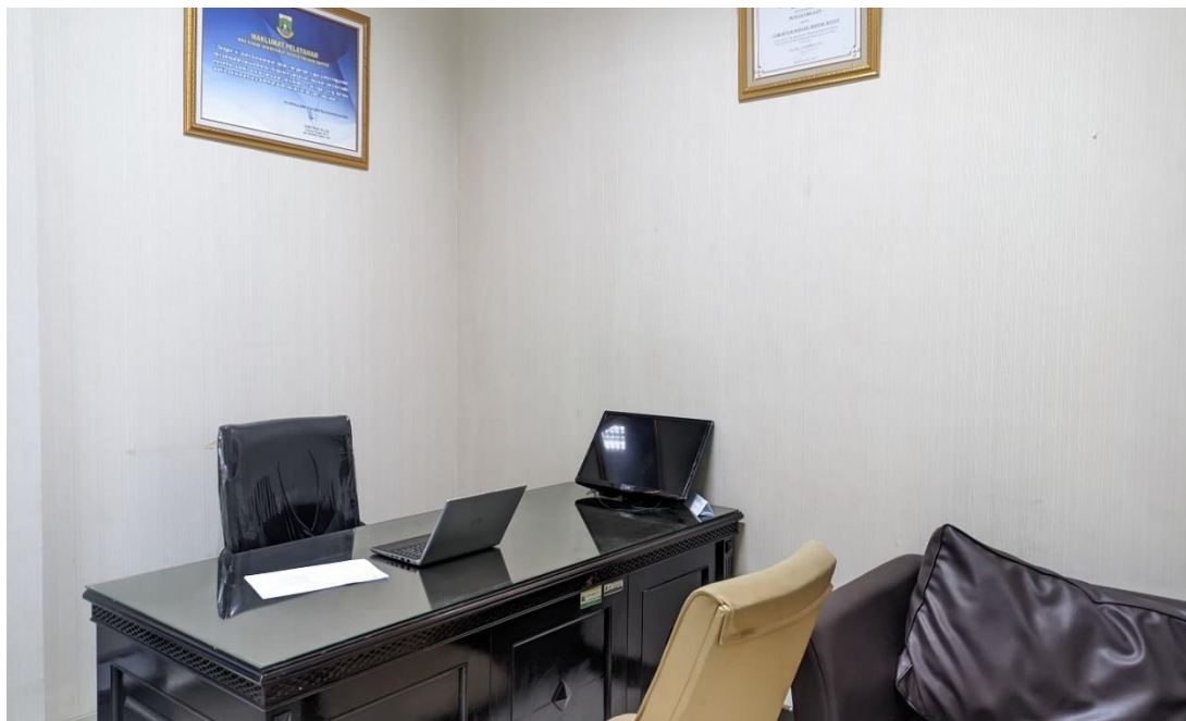
II.1. Gambar ruangan Podcast Biro Hukum

Terdapat desk layanan informasi dan perpustakaan hukum yang akan membantu masyarakat memperoleh informasi, baik dalam bentuk hardcopy maupun softcopy. Selain layanan pada desk informasi PPID Pelaksana pada Biro Hukum Sekretariat Daerah Provinsi Banten juga menyediakan sarana sosialisasi dan dokumentasi elektronik, bahkan memfasilitasi masyarakat untuk dapat memperoleh informasi melalui sistem elektronik berbasis website, pada halaman https://jdih.Bantenprov.go.id dan https://birohukum.bantenprov.go.id/ .