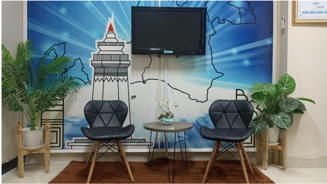
II.2. Gambar ruangan Podcast Biro Hukum