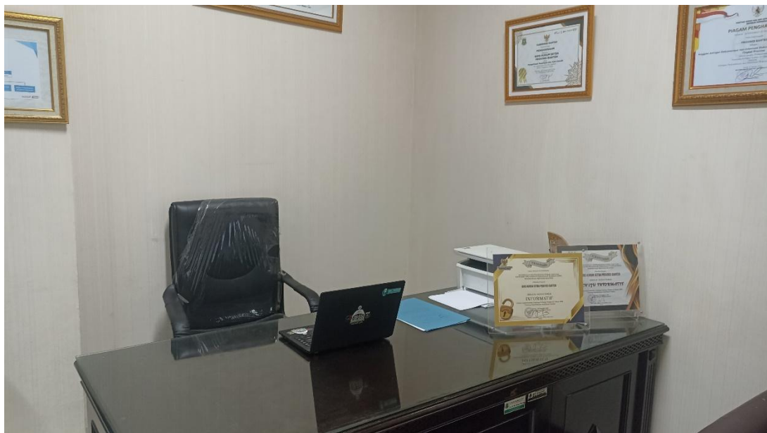
II.1. Gambar ruangan Podcast Biro Hukum

Terdapat desk layanan informasi dan perpustakaan hukum yang akan membantu masyarakat memperoleh informasi, baik dalam bentuk hardcopy maupun softcopy. Selain layanan pada desk informasi PPID Pelaksana pada Biro Hukum Sekretariat Daerah Provinsi Banten juga menyediakan sarana sosialisasi dan dokumentasi elektronik, bahkan memfasilitasi masyarakat untuk dapat memperoleh informasi melalui sistem elektronik berbasis website, pada halaman https://jdih.Bantenprov.go.id dan https://birohukum.bantenprov.go.id/ .